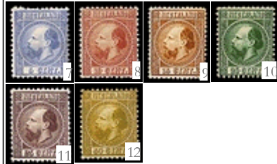
Beeltenis van Koning Willem III.

Onderwerp: Langlopende series, Koning Willem III.