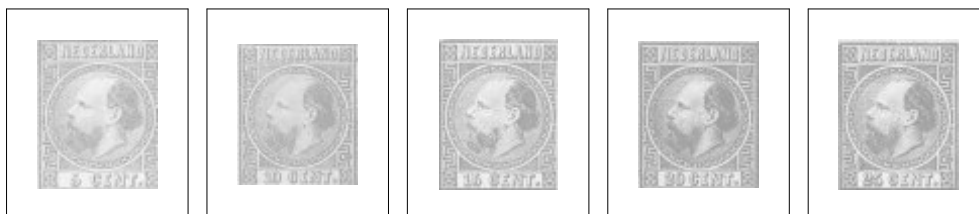
7IIC 5 ct. blauw