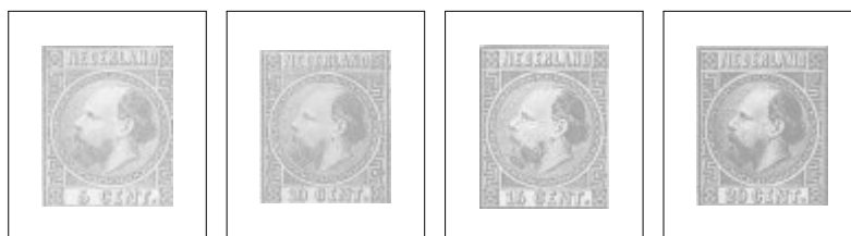
7IIE 5 ct. blauw