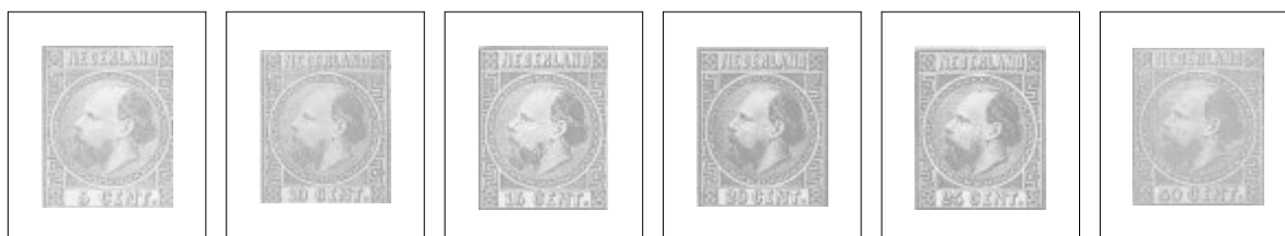
7IID 5 ct. ultramarijn